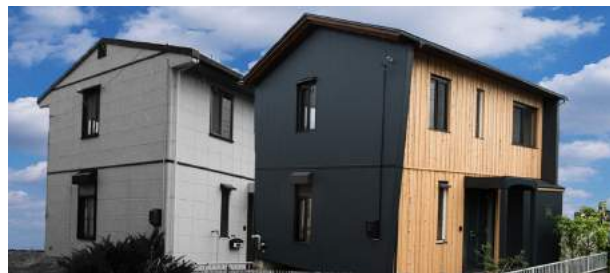
【左：工事前 右：竣工後】

古いものや都合の悪いものを覆い隠すのではなく、余計なものを取り除き、伸びやかな広がり間取りを生み出す。構造と素材美、そして暮らしの楽しさをデザインする。そんな零のリノベスタイルを体現したすまいです。戸建は、マンションとは異なり、まずは構造や断熱への正しい知識と手当が大切。寺岡リノベーション住宅では、こうしたことを体感していただけます。泉パークタウンで住宅購入をご検討の方はもちろん、自宅リノベをご検討の方にもお勧めです。