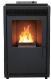
▲木質ペレットストーブ「PE-8」