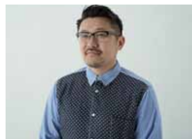
審査委員 齋藤精一

株式会社ライゾマティクス代表取締役 東京理科大学理工学部建築学科 / 京都精華大学デザイン学科 非常勤講師